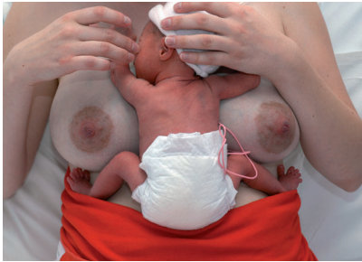
Service de Médecine Néonatale Unité Kangourou, CH Valenciennes

Un soin minutieux doit être porté à l'installation du parent et du bébé en peau à peau. On peut commencer par apprendre aux parents à prendre leur bébé en le soutenant bien sous les fesses et la nuque, puis à l'installer sur leur poitrine. La position recommandée est celle représentée sur la photo ci-dessous.